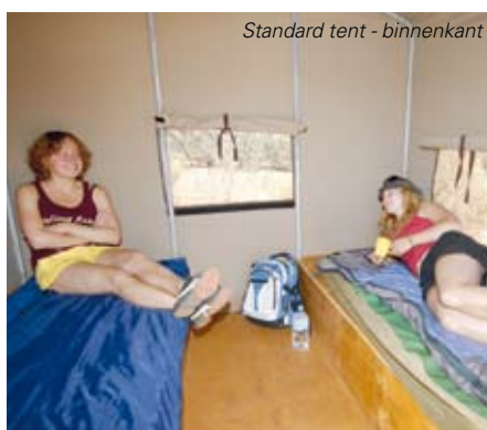
Standard tent - binnenkant

Dag 3: Kings Canyon - Alice Springs (O/L). Klim tot aan de noordrand van de Canyon en wandeling naar de rotsformaties Amfitheater, Garden of Eden en Lost City met spectaculaire uitzichten in de kloof. Na de lunch terugreis naar Alice Springs.