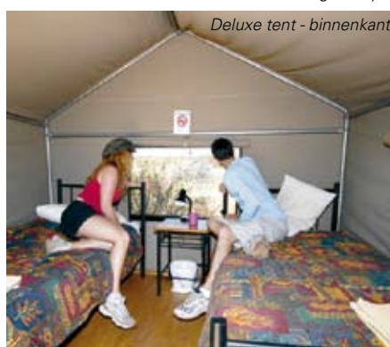
Deluxe tent - binnenkant