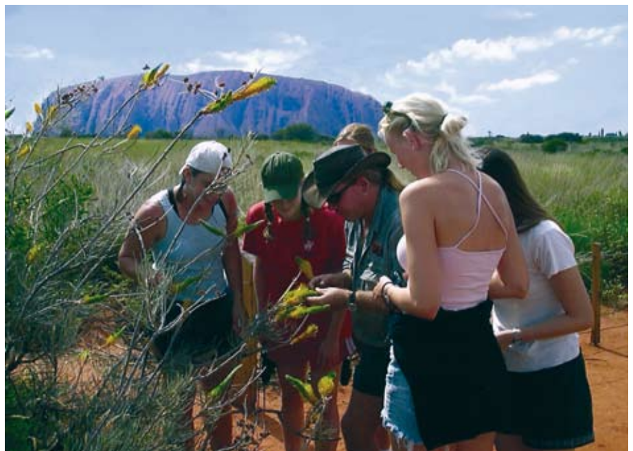
Uitleg over Bushtucker bij Ayers Rock.