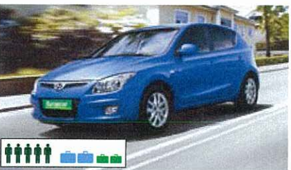
C (IDAR): Hyundai Elantra o.g. (Intermediate Car), automatisch, bestuurder-/passagiersairbags, airco, radio/cd, 4-deurs