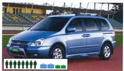
T (PVAR): Kia Carnival o.g. (Minivan), automatisch, airbag, airco, radio/cd, 5-deurs