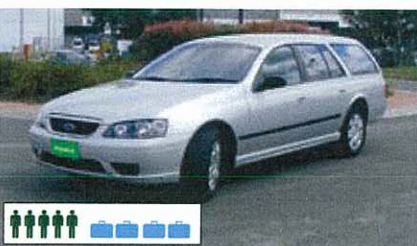
E (FWAR): Ford Falcon Wagon o.g., automatisch, bestuurder-/passagiersairbags, airco, cruise control, radio/cd, 5-deurs