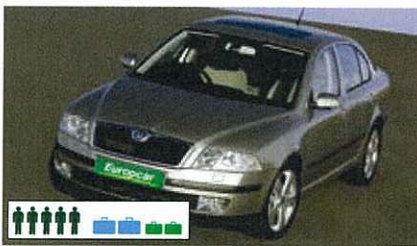
S (SDAR): Skoda Octavia o.g. (Standard Car), automatisch, bestuurder-/passagiersairbags, airco, radio/cd, 4-deurs