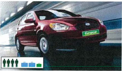
B (CDAR): Hyundai Accent (Compact Car), automatisch, bestuurder-/passagiersairbags, airco, radio/cd, 5-deurs