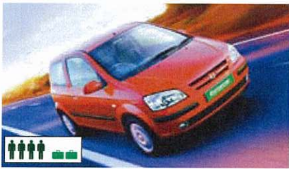
A (ECMR): Hyundai Getz o.g. (Economy Car), handgeschakeld, airco, radio/cd, 3-deurs