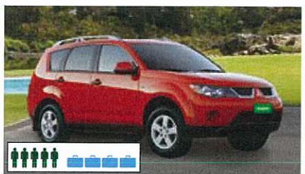
V (IFDR): 4WD Mitsubishi Outlander o.g., automatisch, bestuurder-/passagiersairbags, airco, cruise control, radio/cd, 5-deurs