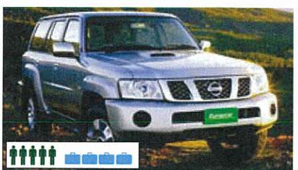
W (FFAR): 4WD Nissan Patrol o.g., automatisch of handgeschakeld, bestuurder-/passagiersairbags, airco, radio/cd, 5-deurs